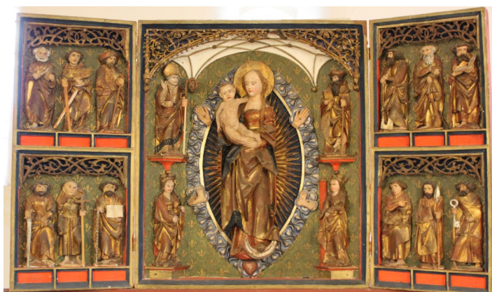
Altar in Pröttlin

*) Zum Abendmahl bitte kleines Glas mitbringen